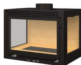
3 faces avec avaloir démontable ou toit plat 3 faces with a removable trap or flat roof