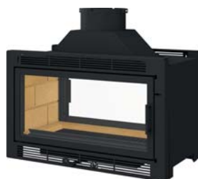
recto-verso avec avaloir démontable ou toit plat recto-verso with a removable trap or flat roof