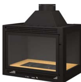
Latéral avec avaloir démontable ou toit plat Latéral with a removable trap or flat roof