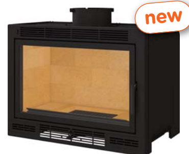
frontal ventilé avec toit plat frontal ventilated flat roof