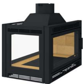
épi avec avaloir démontable ou toit plat épi with a removable trap or flat roof