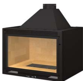
Frontal avec avaloir démontable ou toit plat Frontal with a removable trap or flat roof